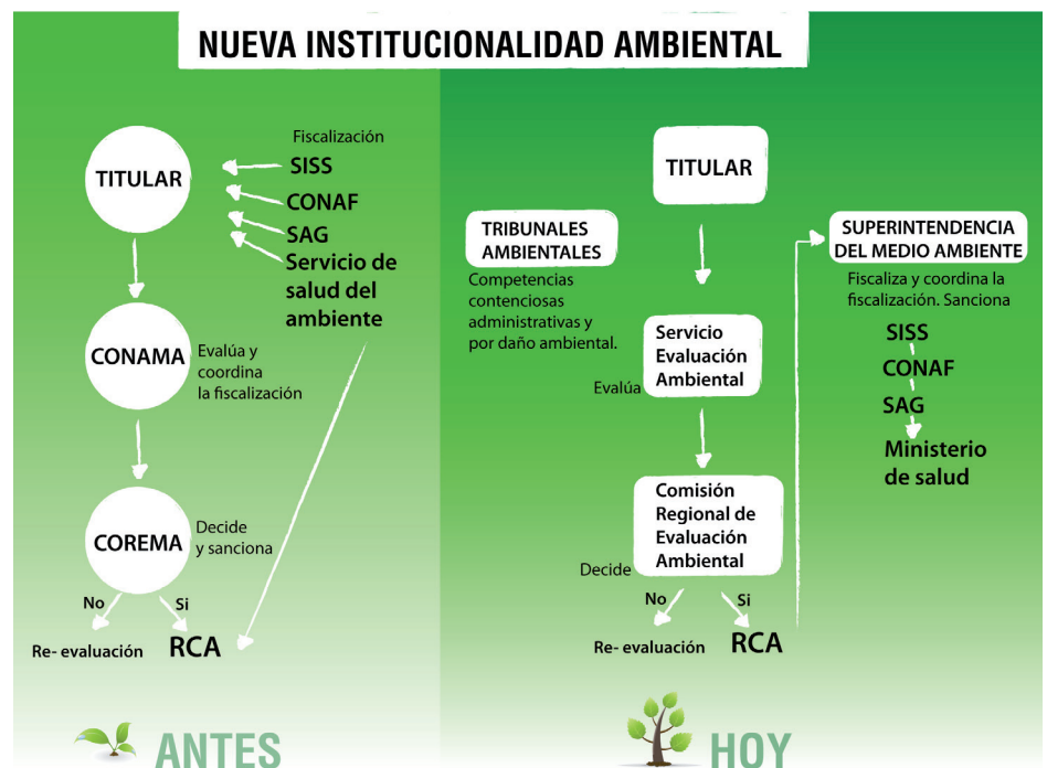
*Diagrama del funcionamiento de la nueva institucionalidad ambiental

En Enero de 2010, con las modificaciones que introdujo la ley 20.417 a la Ley 19.300 sobre Bases del Medio Ambiente, comenzó a operar la nueva institucionalidad ambiental. La nueva ley separa las funciones de evaluación, fiscalización y sanción, creando el Ministerio del Medio Ambiente, a cargo de la política y la regulación; un Servicio de Evaluación Ambiental, encargado de la administración del Sistema de Evaluación de Impacto Ambiental (SEA); y una Superintendencia del Medio Ambiente (SMA), cuya misión es la fiscalización del cumplimiento de compromisos ambientales.